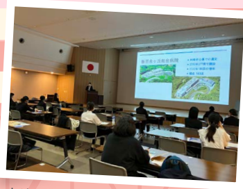
実際の説明会の様子

会場 新百合ヶ丘総合病院 3階 STRホール (神奈川県川崎市麻生区古沢都古255)