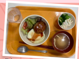
昼食はこちらでご用意(※イメージ)