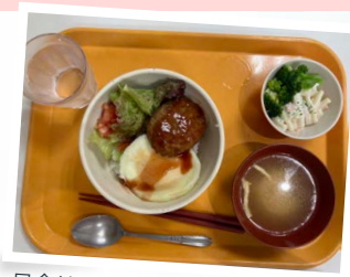
昼食はこちらでご用意(※イメージ)