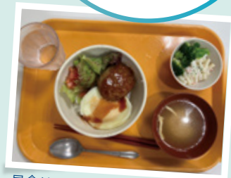
昼食はこちらをご用意(*イメージ)

年の近い先輩職員が同席! 職場の雰囲気やお休みの 取りやすさなどどんなこと でもご質問ください